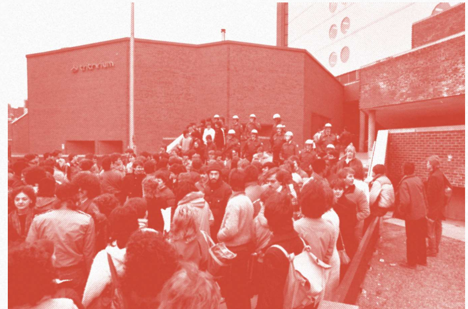
Grève étudiante au Cégep du Vieux Montréal contre l'austérité à l'AFE et la hausse des frais de scolarité (1983)

effondrée de 87 % à 64 % entre 1988 et 2022 — 33 a déjà transformé nos universités en institutions compétitrices en quête de rentabilité et dépendantes des contributions privées. La réforme Legault de 2000 a institutionnalisé cette dynamique en introduisant un financement basé sur les inscriptions (EETP), accentuant la concurrence entre universités et la hiérarchisation des programmes selon leur «rentabilité». Ces transformations ont soumis les universités (mais aussi les collèges) aux exigences du marché : production de diplômé-e-s adapté-e-s aux besoins du capital, brevetage et commercialisation de la recherche, et valorisation des formations les plus profitables. Constamment appeler l'État à