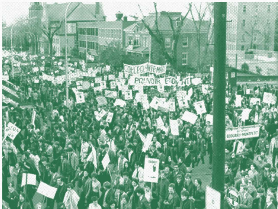
Manifestation étudiante à Montréal pour l'accessibilité aux études et pour gestion une démocratique étudiante des institutions (1968)

Ainsi, nous avons choisi de structurer ce document sous forme de questions-réponses : pour démonter les mythes sur la condition étudiante et pour explorer les différents enjeux autour du salariat étudiant.