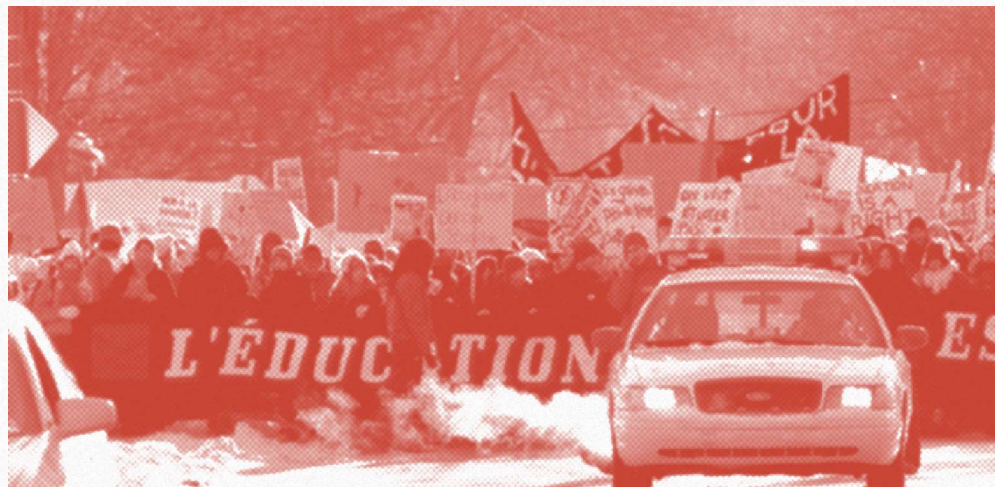
Manifestation étudiante pour la bonification du programme de prêts et bourses (2008)

Un salaire universel pour toutes les étudiant-e-s renverserait ces logiques en valorisant équitablement toutes les contributions intellectuelles et sociales, sans distinction de discipline ou de programme. Refuser de segmenter la reconnaissance du travail étudiant, c'est rejeter l'idée que certaines formations sont plus légitimes que d'autres, tout en sapant les fondements des hiérarchies sociales et économiques que l'éducation contribue à reproduire.