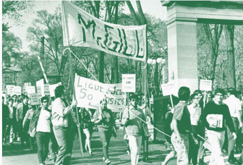
Manifestation de solidarité par les étudiant-e-s de McGill pour la gestion démocratique des cégeps (1968)

Enfin, il faut déduire les montants déjà engagés par l'État, notamment les 607 millions $ en bourses versées via l'AFE et les 97 millions $ correspondant aux intérêts assumés sur les prêts étudiants pendant la période d'études. 29 Après ces ajustements, le coût net du salariat étudiant pour 2024-2025 est estimé à 8,96 milliards $.