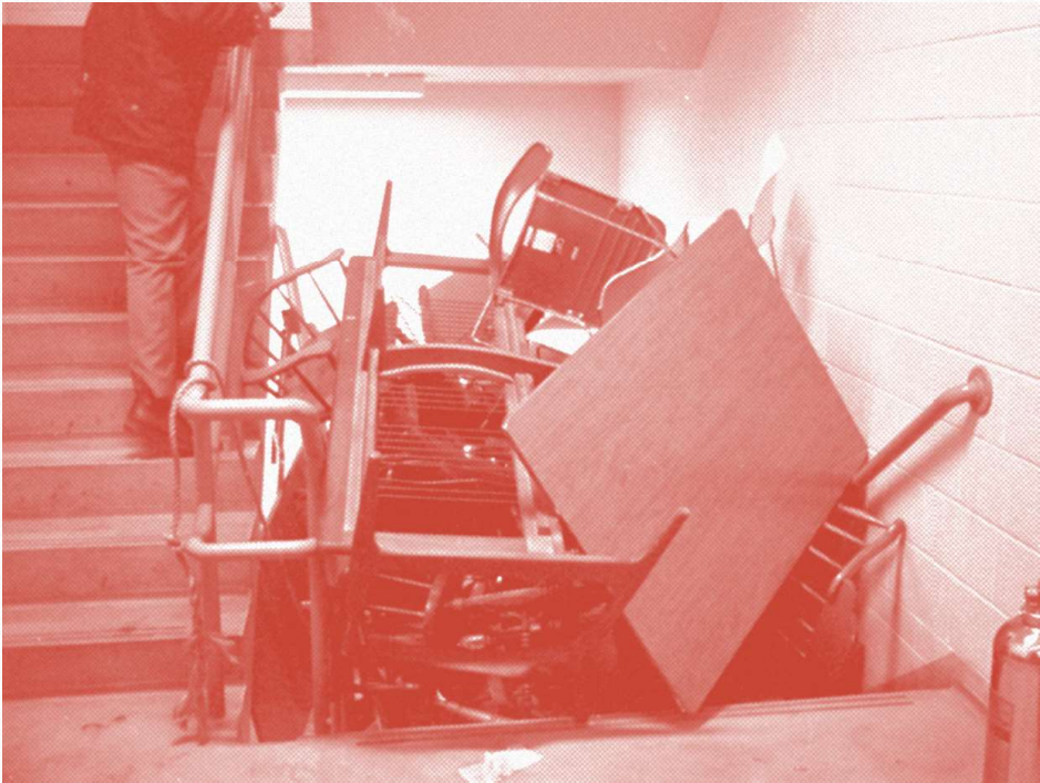
Occupation étudiante à l'Université Sir George Williams (aujourd'hui l'Université Concordia) pour contester le laxisme de l'administration dans le traitement d'une plainte pour racisme déposée par six étudiants antillais (1969)