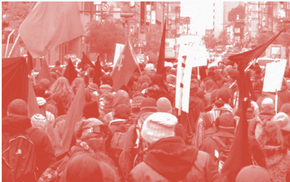
Manifestation étudiante contre les compressions dans le programme de bourses de l'AFE (2005)

De manière plus immédiate, le salariat étudiant permet de développer notre puissance d'agir collective. En nous organisant pour l'obtenir, nous nous donnons l'opportunité de construire des structures de lutte qui dépassent les cadres institutionnels traditionnels. Ces formes d'auto-organisation constituent des laboratoires d'expérimentation de rapports sociaux alternatifs, où s'élaborent des pratiques de démocratie directe et de solidarité concrète. L'expérience de la lutte elle-même devient ainsi un espace d'apprentissage collectif des moyens de notre émancipation.