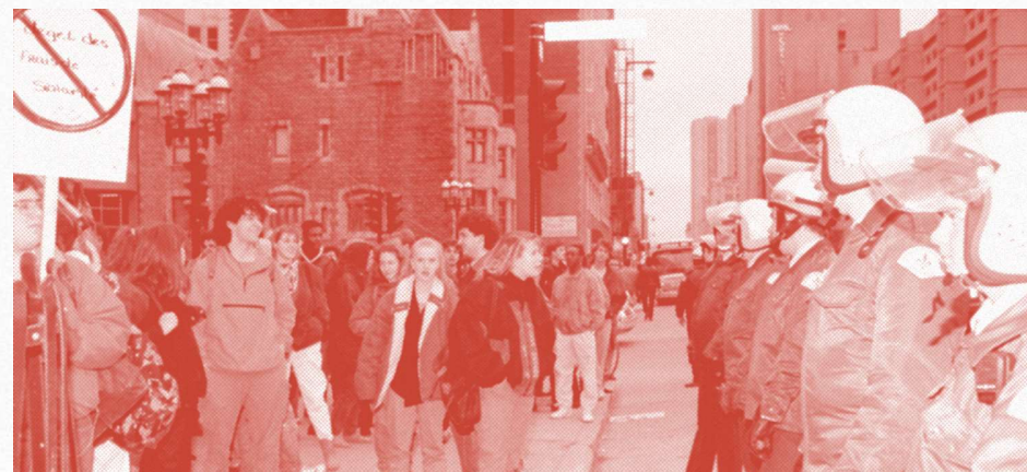
Manifestation étudiante contre le dégel des frais de scolarité (1990)

Plus encore, le salariat étudiant pourrait nous libérer partiellement de l'emprise du marché. En nous assurant une autonomie financière, il nous permettrait de choisir nos parcours d'études en fonction de nos aspirations et des besoins réels de la société, plutôt que des seules exigences du capital. Il représente ainsi une première étape vers une réappropriation collective de nos institutions d'enseignement des logiques marchandes qui les étouffent. Notre lutte pour le salariat étudiant s'inscrit donc dans un combat plus large : celui pour une éducation véritablement émancipatrice, au service des intérêts populaires plutôt que du profit.