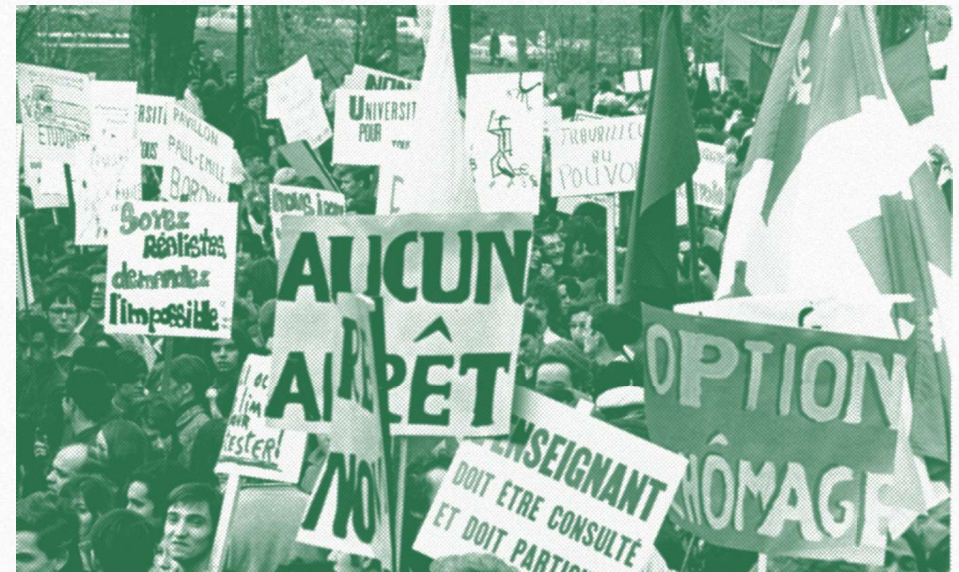
Manifestation étudiante à Montréal pour l'accessibilité aux études et pour une gestion démocratique étudiante des institutions (1968)

Une politique salariale inclusive doit reconnaître les réalités particulières des étudiant-e-s. Par exemple, les dépenses des étudiant-e-s avec des limitations fonctionnelles ou des maladies graves sont 11 % à 13 % plus élevées que la moyenne. 26 Avec environ 5,6 % des étudiant-e-s vivant avec un handicap, 27 un